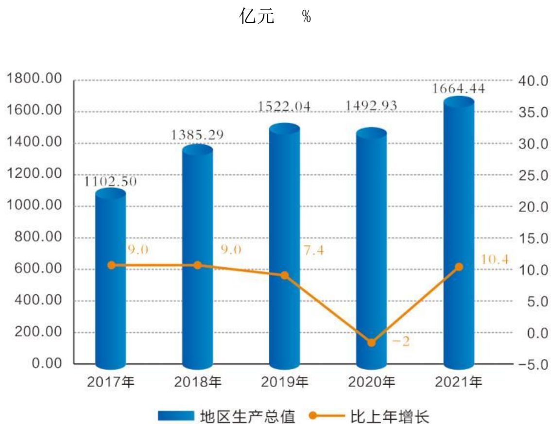
图 1：2017—2021 年地区生产总值及其增长速度