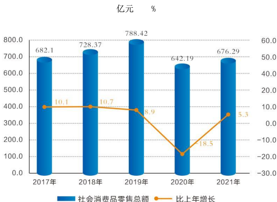
图 5：2017—2021 年社会消费品零售总额及其增长速度

限上批发和零售业企业实现社零额 120.51 亿元，同比下降 1.7%；限上住宿和餐饮业实现社零额 40.87 亿元，同比增长 36.54%。