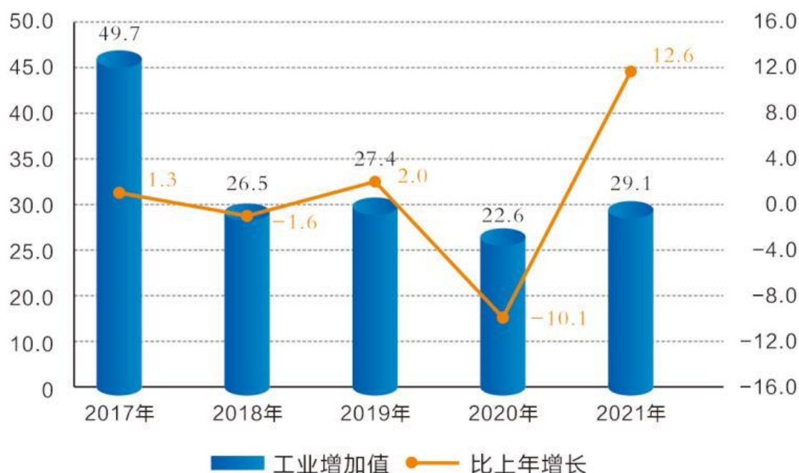
图 3：2017—2021 年全部工业增加值及其增长速度 亿元、%

年末规模以上工业企业中产值过亿的企业 14 户。在 18 个工业行业中，11 个行业产值超亿元，分别是农副食品加工业，印刷和记录媒介复制业，非金属矿物制品业，通用设备制造业，专用设备制造业，电气机械和器材制造业，计算机、通信和其他电子设备制造业，仪器仪表制