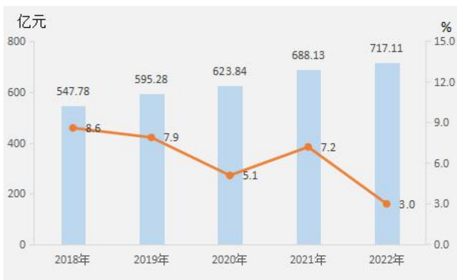
图 1 2018 年——2022 年地区生产总值及其增长速度

全年民营经济增加值 412.30 亿元，比上年增长 2.8%，占 GDP 的比重为 57.5%，对 GDP 增长的贡献率为 52.5%。其中，第一产业中民营经济增加值 3.48 亿元，增长 17.7%；第二产业中民营经济增加值 174.73 亿元，增长 4.0%；第三产业中民营经济增加值 234.09 亿元，增长 1.7%。