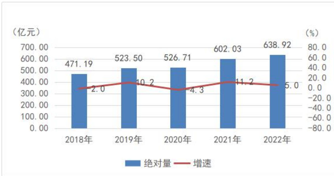
图 1 2018-2022 年地区生产总值及其增长速度