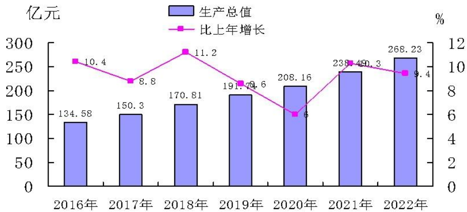
图1 2016年--2022年生产总值及增长速度

全市居民消费价格总水平比上年上涨 0.8%。居民消费价格中，食品烟酒价格下降 0.4%（其中粮食价格上涨 0.3%）；衣着价格上涨 0.7%；居住价格上涨 2.4%；生活用品及服务价格上涨 0.9%；交通通信价格上涨 3.7%；教育文化和娱乐价格上涨 0.5%；医疗保健价格下降 3.7%；其他用品和服务价格上涨 2.5%。商品零售价格总水平上涨 3.8%。