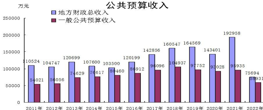
图5 2011年--2022年地方财政总收入及一般公共预算收入

全年完成地方财政总收入（一般公共预算收入+上划收入）75694万元，比上年减收117264万元，下降60.8%。其中：上划中央收入5078万元，下降93.5%；上划省级收入11685万元，下降38.7%；一般公共预算收入58931万元，下降38.6%。完成政府性基金预算收入52879万元，比上年增收9263万元，增长21.2%。完成一般公共预算支出295889万元，比上年减支35058万元，下降10.6%；完成政府性基金预算支出92941万元，比上年减支45702万元，下降33.0%。