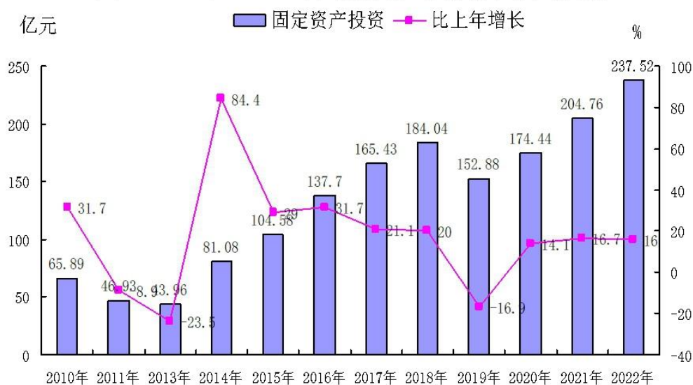
图4 2010年--2022年固定资产投资及增长速度