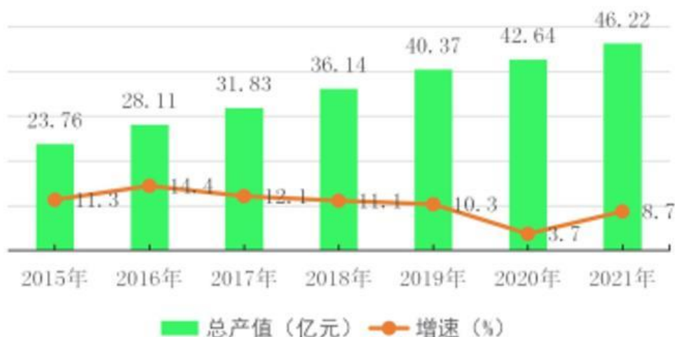
图1 雷山地区生产总值及增速