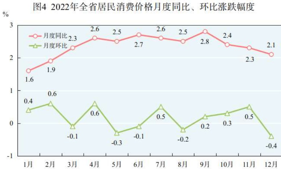
表 2 2022 年居民消费价格比上年涨跌幅度

全年居民消费价格总水平比上年上涨 2.4%。其中，城市上涨 2.4%，农村上涨 2.3%。