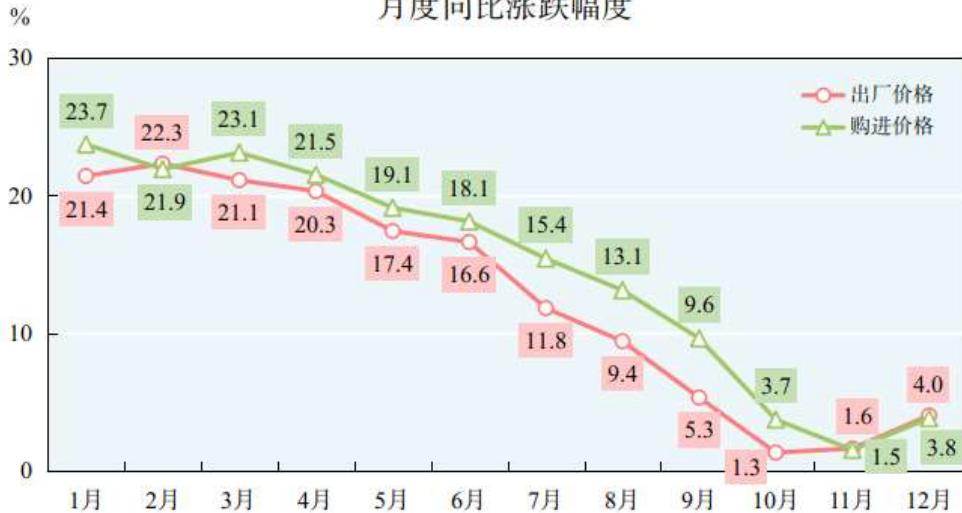
图5 2022年全省工业生产者出厂价格、购进价格 月度同比涨跌幅度

全年工业生产者出厂价格比上年上涨 12.2%，工业生产者购进价格上涨 14.0%。西宁市新建商品住宅销售价格指数下降 2.0%，二手住宅销售价格指数下降 2.1%。