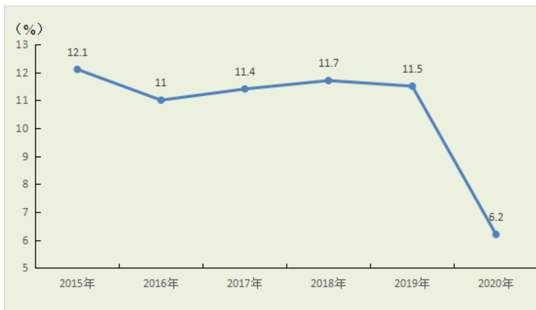
图三 2015-2020 年规模以上工业增加值增速

在规模以上工业企业中，按登记注册类型分组，内资企业个数占规模以上工业的比重为 98.2%，外商及港澳台商投资企业个