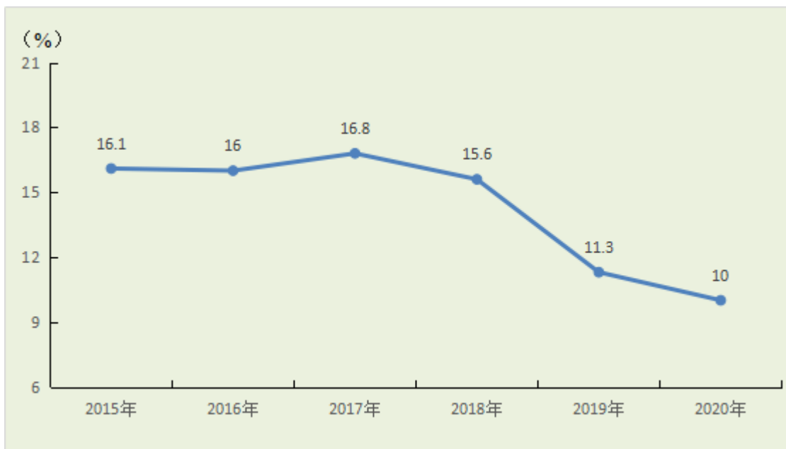
图四 2015-2020 年固定资产投资增速

在全社会固定资产投资完成额中，第一产业投资 17.76 亿元，增长 79.0%；第二产业投资 68.68 亿元，增长 13.3%，其中工业投资增长 11.7%；第三产业投资 67.81 亿元，下降 2.7%，总量占全社会固定资产投资的 43.96%。在全社会固定资产投资中，建安工程投资 96.84 亿元，比上年增长 7.7%；更新改造投资 52.96 亿元，增长 16.7%。