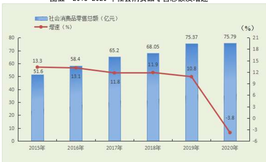
图五 2015-2020 年社会消费品零售总额及增速

分行业看，批发业零售总额 12.7 亿元，比上年下降 5.8%；零售业零售总额 52.1 亿元，下降 3.0%；住宿业零售总额 1.8 亿