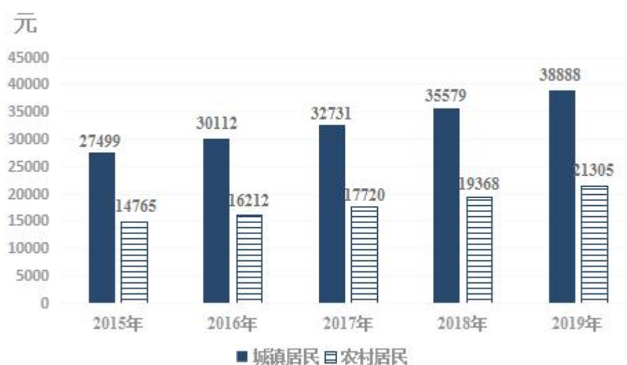
图 4 2015-2019 年城镇和农村居民可支配收入

年末城乡居民养老保险参保 53.78 万人，参保缴费 3.58 亿元，城镇职工养老保险参保 17.69 万人，城镇职工基本养老保险基金征收 11.37 亿元。城镇职工基本医疗保险参保 15.94 万人；城乡居民基本医疗保险参保 66.26 万人，参保率 99.2%；工伤保险参保 6.12 万人；生育保险参保 6.18 万人。