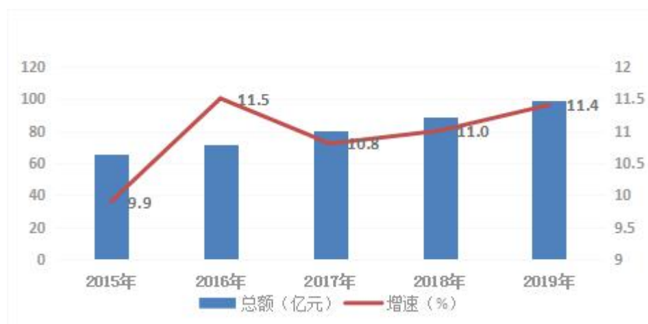
图 2 2015-2019 年社会消费品零售总额及增速

鼓励非公有制企业参与国际竞争，大力培育外贸主体队伍，全年新增对外贸易备案企业 21 家，全年实现外贸进出口总额 24.1 亿元。