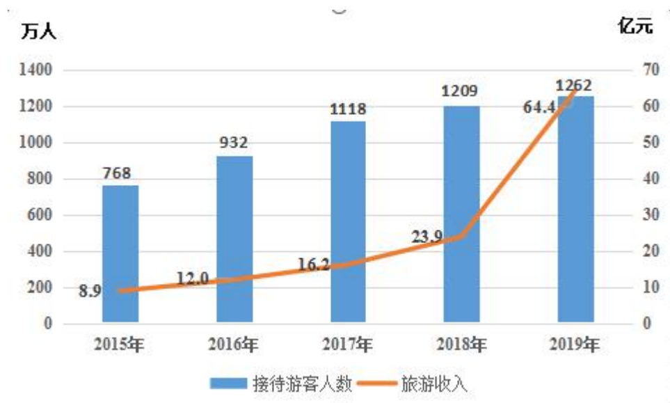
图 3 2015-2019 年接待游客人数和旅游收入趋势图

推动文农商体旅融合发展，荣获“2019 文旅融合发展优秀城市”和“2019 特色旅游魅力城市”。全年接待游客人数 1261.7 万人次，实现旅游收入 64.4 亿元，同比增长 4.4%、168.9%。接待乡村旅游游客 946.3 万人次，实现乡村旅游收入 48.3 亿元，分别增长 4.4%、161.9%。