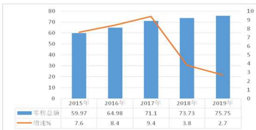
图 3：2015-2019 年社会消费品零售总额增速 (%)

长 1.8%；集体经济零售额 0.92 亿元，增长 39.4%；私营经济零售额 9.63 亿元，增长 9.2%；个体经济零售额 44.68 亿元，增长 6%；股份制经济零售额 17.15 亿元，下降 9.3%；其他各种经济零售额 3 亿元，增长 5.8%。分行业看，批发业零售额 17.33 亿元，下降 9.7%；零售业零售额 31.44 亿元，增长 10.5%；住宿业零售额 3.14 亿元，增长 40.4%；餐饮业零售额 23.84 亿元，与去年同期持平。