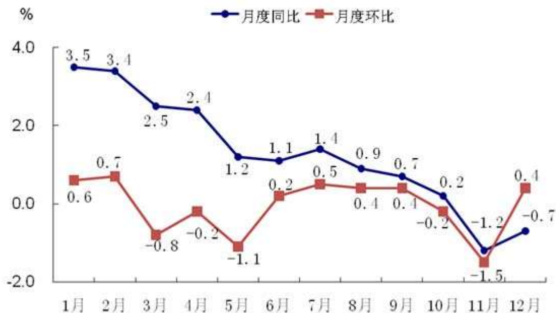
表 1 2020 年市辖区居民消费价格比上年涨跌幅度