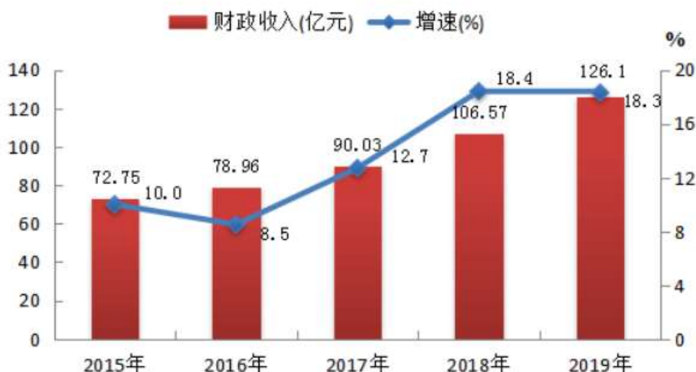
图10 2015—2019年贵港市财政收入及其增速