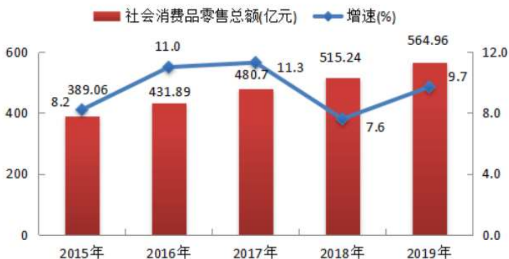
图8 2015—2019年社会消费品零售总额及其增速

全年全市社会消费品零售总额 564.96 亿元，比上年增长 9.7%。按经营地统计，城镇消费品零售额 410.12 亿元，增长 9.5%；乡村消费品零售额 154.83 亿元，增长 10.2%。按消费类型统计，商品零售额 535.35 亿元，增长 7.7%；餐饮收入 32.61 亿元，增长 54.7%。