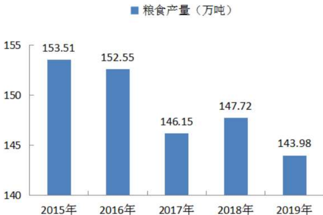
表3 2019年主要农产品产量及其增长速度