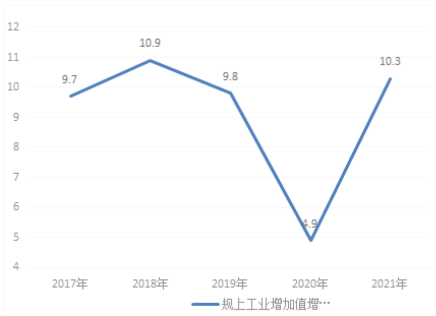
图 2 2017-2021 年规模以上工业增加值增长速度

在规模以上工业中，分轻重工业看，轻工业增加值比上年增长 10.6%，重工业增加值增长 10.1%。分经济类型看，大中型企业增长 15.5%，国有控股企业增长 7.9%，股份制企业增长 11.8%，外商及港澳台商投资企业增长 11.2%。分重点产业看，锂电及新材料产业增加值增长 41.4%，电子信息产业增长 19.7%，机械装备产业下降 7.4%，油气盐化工产业增长 18.2%，食品饮料产业增长 24.5%。