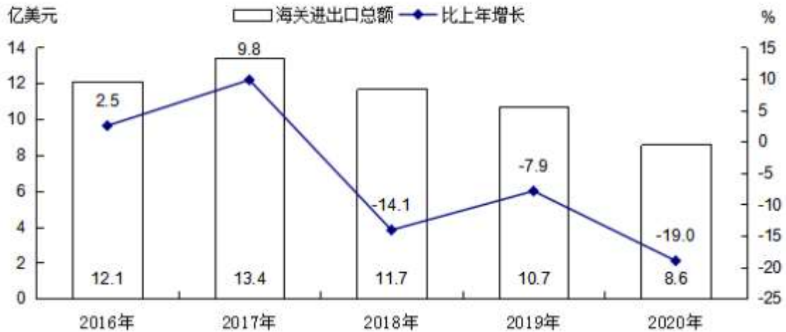
图 5 2016—2020 年货物进出口总额及其增长速度

全年进口锰矿砂 10.2 亿元，下降 3.6%；进口铜矿砂 20 亿元，下降 27.5%；进口铬矿砂 2.9 亿元，增长 16.1%。全年出口镁及镁制品 6.0 亿元，增长 0.7%；出口机电产品 5.3 亿元，下降 11.6%；出口果蔬汁 1.3 亿元，增长 11.8%；出口纺织物 3.8 亿元，下降 19.7%。