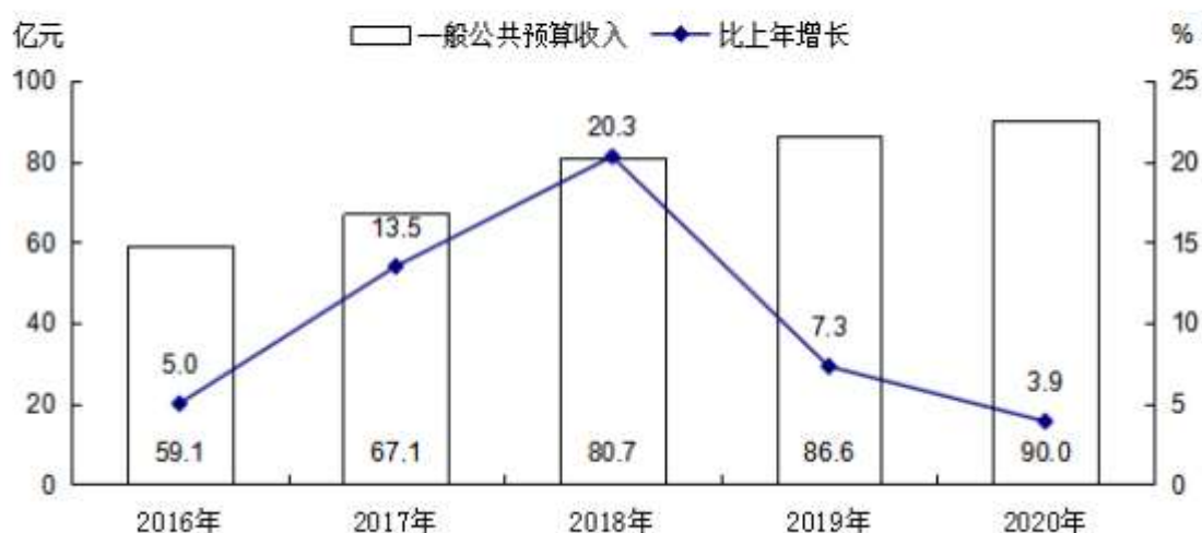
图 6 2016—2020 年一般公共预算收入及其增长速度

金融：年末全部金融机构本外币各项存款余额 2847.1 亿元，比年初增长 14.4%，其中人民币各项存款余额 2842 亿元，比年初增长 14.4%。全部金融机构本外币各项贷款余额 1450.7 亿元，比年初增长 14.1%，其中人民币各项贷款余额 1450.1 亿元，比年初增长 14.2%。