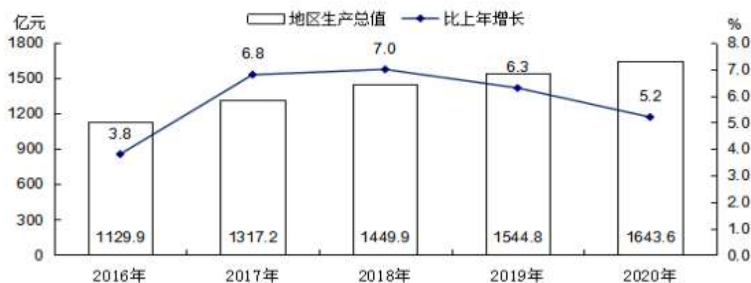
图 1 2016—2020 年地区生产总值及其增长速度

就业：全年全市城镇新增就业人员 52379 人，转移农村劳动力 71833 人，城镇失业人员再就业 12522 人，就业困难人员实现就业 3745 人。年末城镇登记失业率 3.13%。