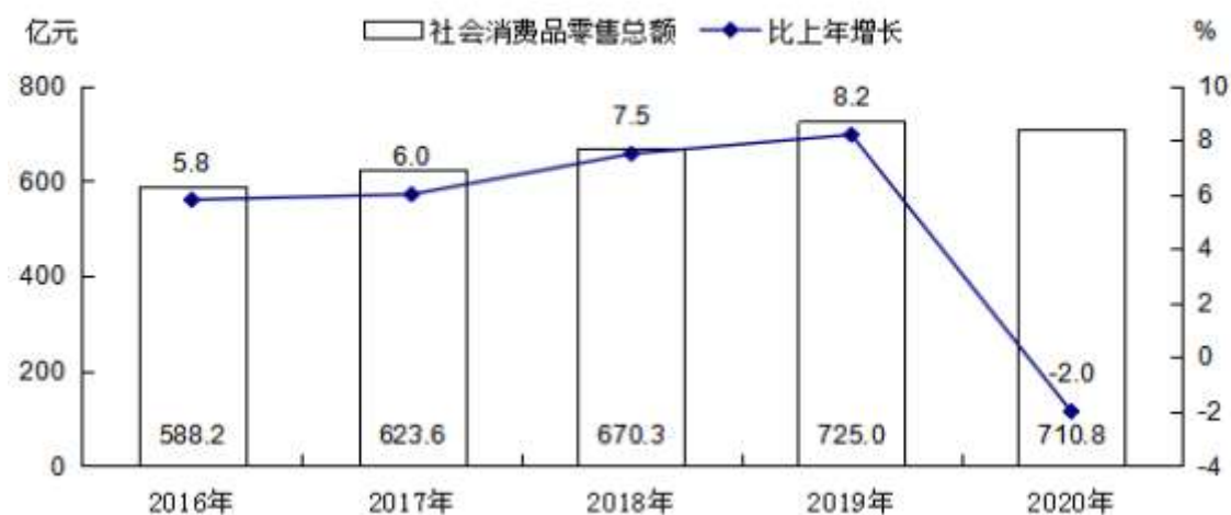
图4 2016—2020年社会消费品零售总额及其增长速度

在限额以上单位消费品零售额中，粮油、食品类零售额比上年增长25.7%，烟酒类下降14.0%，服装、鞋帽、针纺织品类增长1.5%，化妆品类增长13.6%，金银珠宝类下降1.4%，日用品类增长71.8%，家用电器和音像器材类下降3.8%，中西药品类增长12.7%，家具类下降25.5%，建筑及装潢材料类增长24.0%，石油及制品类增长2.2%，汽车类增长3.7%。