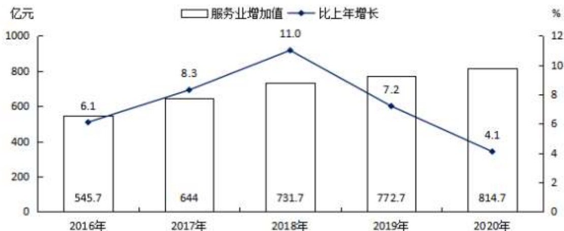
图 3 2016-2020 年服务业增加值及其增长速度

年末全市公路通车里程 16096 公里，其中，国道 1236 公里，省道 708 公里，县道 2721 公里，乡、村道及专用道 11432 公里；高速公路 603 公里。全市公路密度 113.5 公里/百平方公里。全年公路客运量 468.5 万人，比上年下降 72.5%；公路货运量 13595.2 万吨，比上年下降 38.8%。公路旅客运输周转量 4.4 亿人公里，比上年下降 61.1%；公路货物运输周转量 421.4 亿吨公里，比上年下降 15.4%。