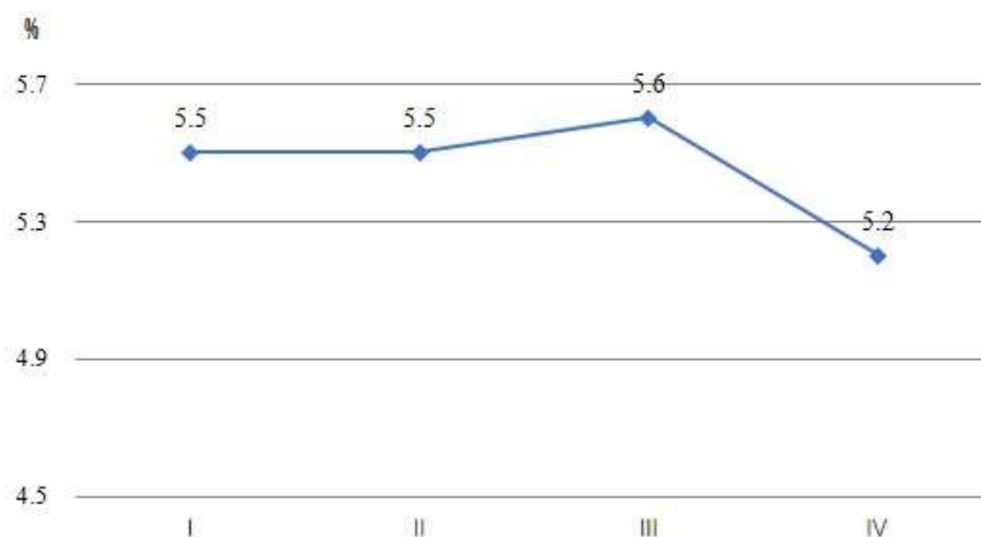
图1 2019年内蒙古生产总值季度累计增速

年末全区常住人口 2539.6 万人，比上年末增加 5.6 万人。其中，城镇人口 1609.4 万人，乡村人口 930.2 万人；常住人口城镇化率达 63.4%，比上年提高 0.7 个百分点。男性人口 1308.3 万人，女性人口 1231.2 万人。全年出生人口 20.9 万人，出生率为 8.23‰；死亡人口 14.4 万人，死亡率为 5.66‰；人口自然增长率为 2.57‰。